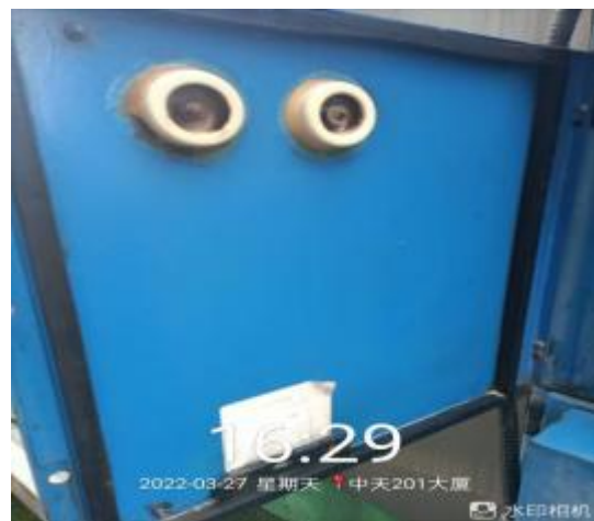
净化器机箱清洗后