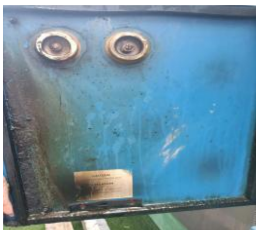
净化器机箱清洗前