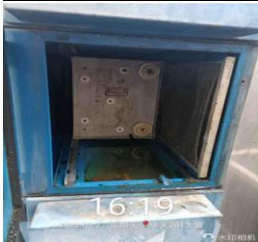
净化器机箱清洗前