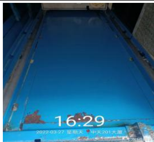
净化器机箱清洗后